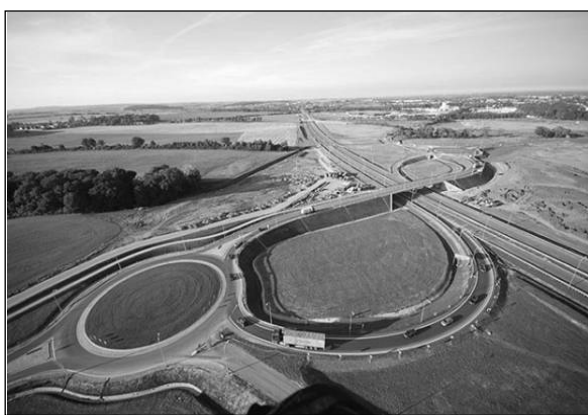
Fot. 1. Węzeł „Rusocin”.

Węzeł „Pelplin” (fot. 2) znajduje się na 37 km inwestycji A-1, pomiędzy węzłami „Swarożyn” (25-26 km) i „Kopytkowo” (59 km). Powstał tu również obwód utrzymania autostrady. Schemat węzła jest klasycznym rozwiązaniem typu trąbka ze stacją poboru opłat. Rzeźba terenu wokół węzła jest bardzo urozmaicona.