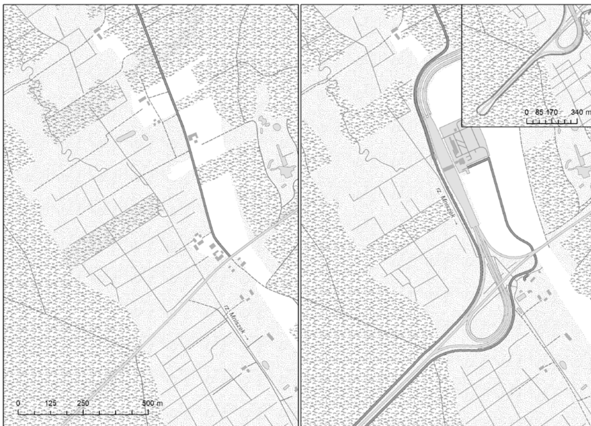
Ryc. 2. Zmiany w sieci dróg lokalnych na obszarze węzła „Nowe Marzy”.

ekranową. W efekcie powstały trzy mapy przedstawiające obszary przed wybudowaniem węzła autostradowego i trzy mapy przedstawiające obszar po wybudowaniu węzła (ryc. 2). Wykonane mapy zostały jeszcze raz przekształcone. Celem tego działania było stworzenie szeregu map tematycznych.