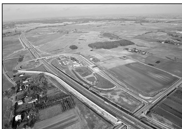
Fot. 2. Węzeł „Pelplin”.