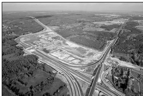
Fot. 3. Węzeł „Nowe Marzy”.

Węzeł zlokalizowano na niewielkim wzniesieniu, które opada na zachód, w kierunku doliny rzeki Węgermucy. Zróznicowane ukształtowanie terenu wymusiło liczne prace niwelacyjne oraz budowę wkopów i nasypów. Droga wojewódzka nr 229, przecinająca autostradę, została przebudowana i poprowadzona we wkopie na odcinku ponad 500 m. Również droga do wsi Nowy Dwór zyskała częściowo nowy bieg. Podczas wykonywania prac ziemnych zasypano na terenie węzła dwa oczka wytopiskowe, które znajdowały się w niewielkim podmokłym zagłębieniu. Mniejsze oczko wytopiskowe, znajdujące się w północnej części zagłębienia, było porośnięte trzciną i wysoka trawą wśród których rozwijała się roślinność krzewiasta. Większy zbiornik znajdował się w południowej części zagłębienia. Teren na którym znajdowały się oczka wodne został prawie w całości wyrównany. Zaplanowany zakres prac niwelacyjnych wykonano tylko częściowo. Nadal pozostały dwa nieregularne zagłębienia z rozwijającą się roślinnością charakterystyczną dla terenów podmokłych. Na terenie tym znajduje się również odstożnik wód opadowych, który w niewielkiej części pokrywa się z wcześniej istniejącym oczkiem wytopiskowym.